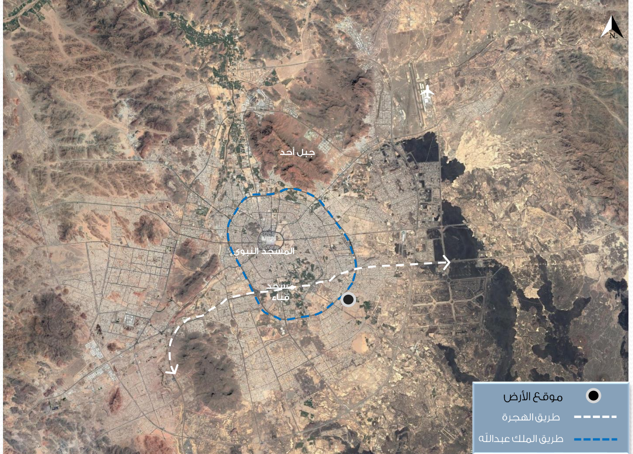
موقع العقار على مستوى المدينة

المدينة المنورة هي أول عاصمة في تاريخ الاسلام، ثاني أقدس الأماكن لدى المسلمين بعد مكة. تقع المدينة المنورة غرب شبه الجزيرة العربية، وهي مقر إمارة منطقة المدينة المنورة حسب التقسيم الإداري للمناطق السعودية. تتميز بمجموعة من أجمل المعالم الدينية والتي أهمها المسجد النبوي، ومسجد قباء، ومسجد القبلتين بالإضافة الى مقبرة البقيع التي تعد المقبرة الرئيسية لأهل المدينة.