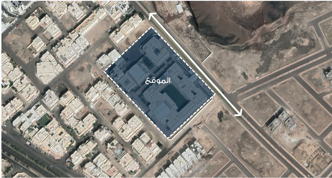
صورة توضح حدود العقار