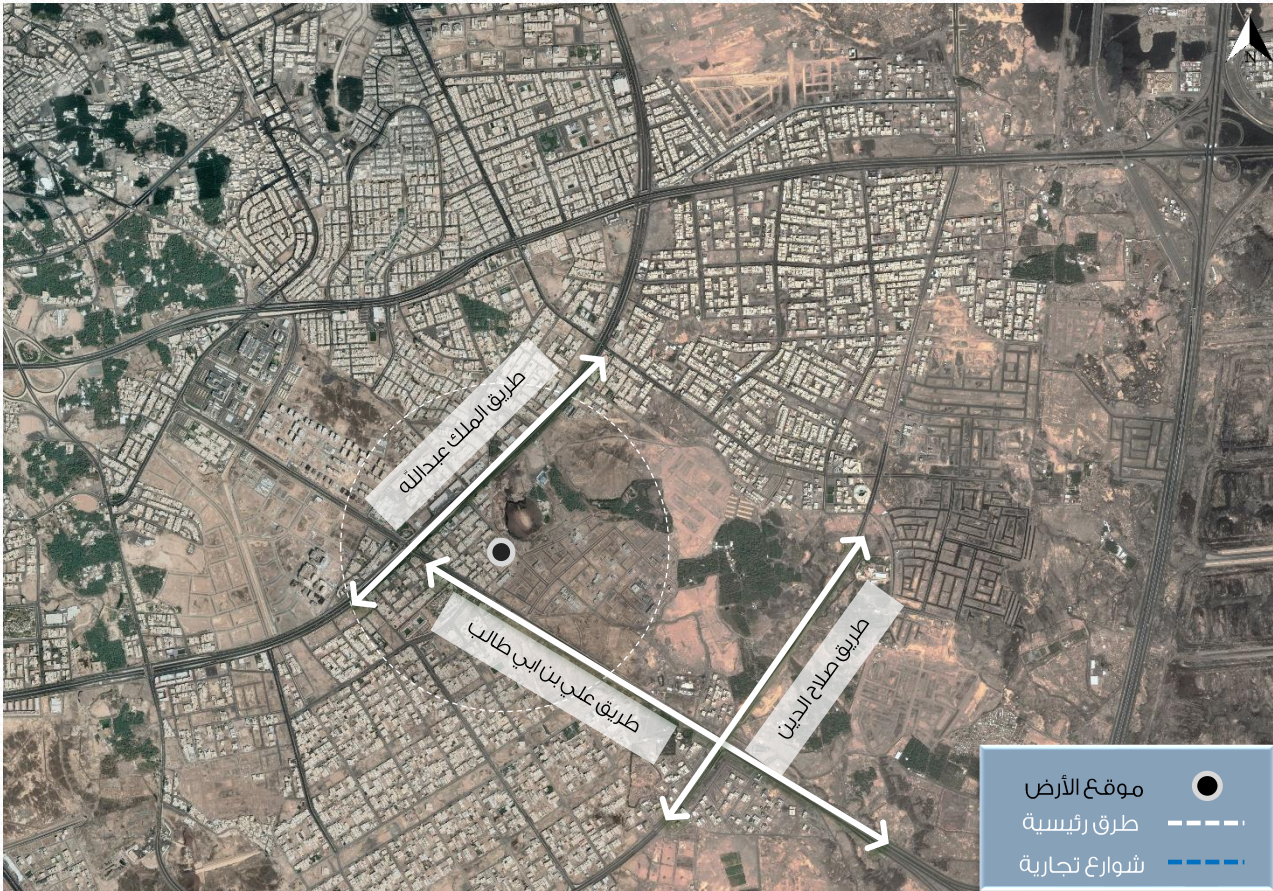
صورة توضح حدود العقار على مستوى الأحياء

تتميز منطقة العقار بموقعها الجغرافي على مستوى مدينة المدينة المنورة ، حيث تقع بالقرب من عدة طرق رئيسية كطريق الملك عبدالله . كما يحد منطقة العقار من الجهة الشمالية طريق الملك عبدالله ، ومن الجهة الجنوبية فيحد منطقة العقار طريق صلاح الدين، وكذلك يحد منطقة العقار من الجهة الشرقية اجزاء من الحي، ومن الجهة الغربية فيحد منطقة العقار طريق علي بن ابي طالب.